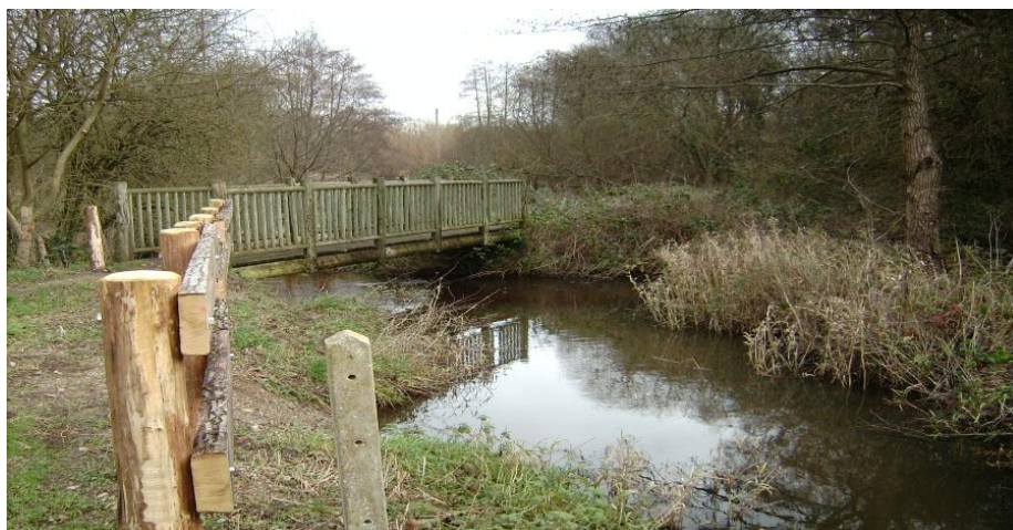
Le Gué de la Pichotière