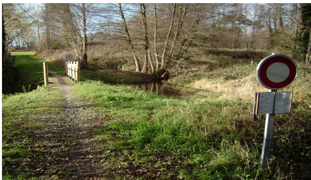
Le gué du « Pré de la Planche »

Si d'aventure votre chemin vous guide, par une belle journée, vers ces lieux enfouis dans la nature, en marge des principaux axes de circulation de la commune, profitez d'un temps de pleine respiration. Ces lieux valent bien quelques minutes de ...ressourcement.