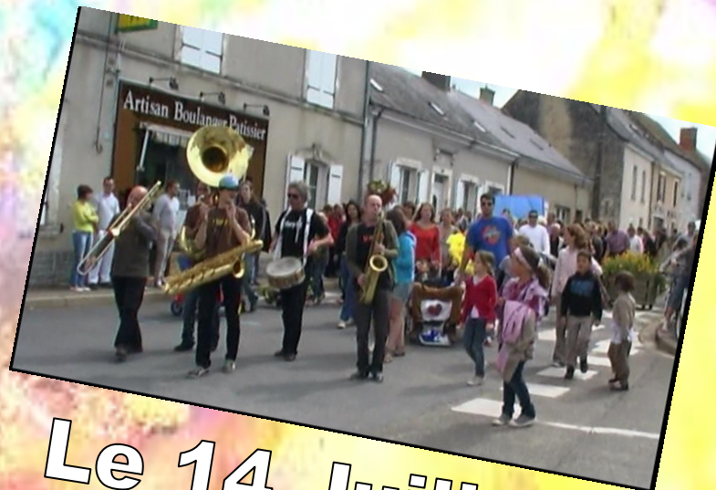
Le 14 Juillet