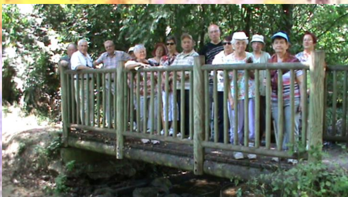
Après-midi récréatif des Aînés de Challes