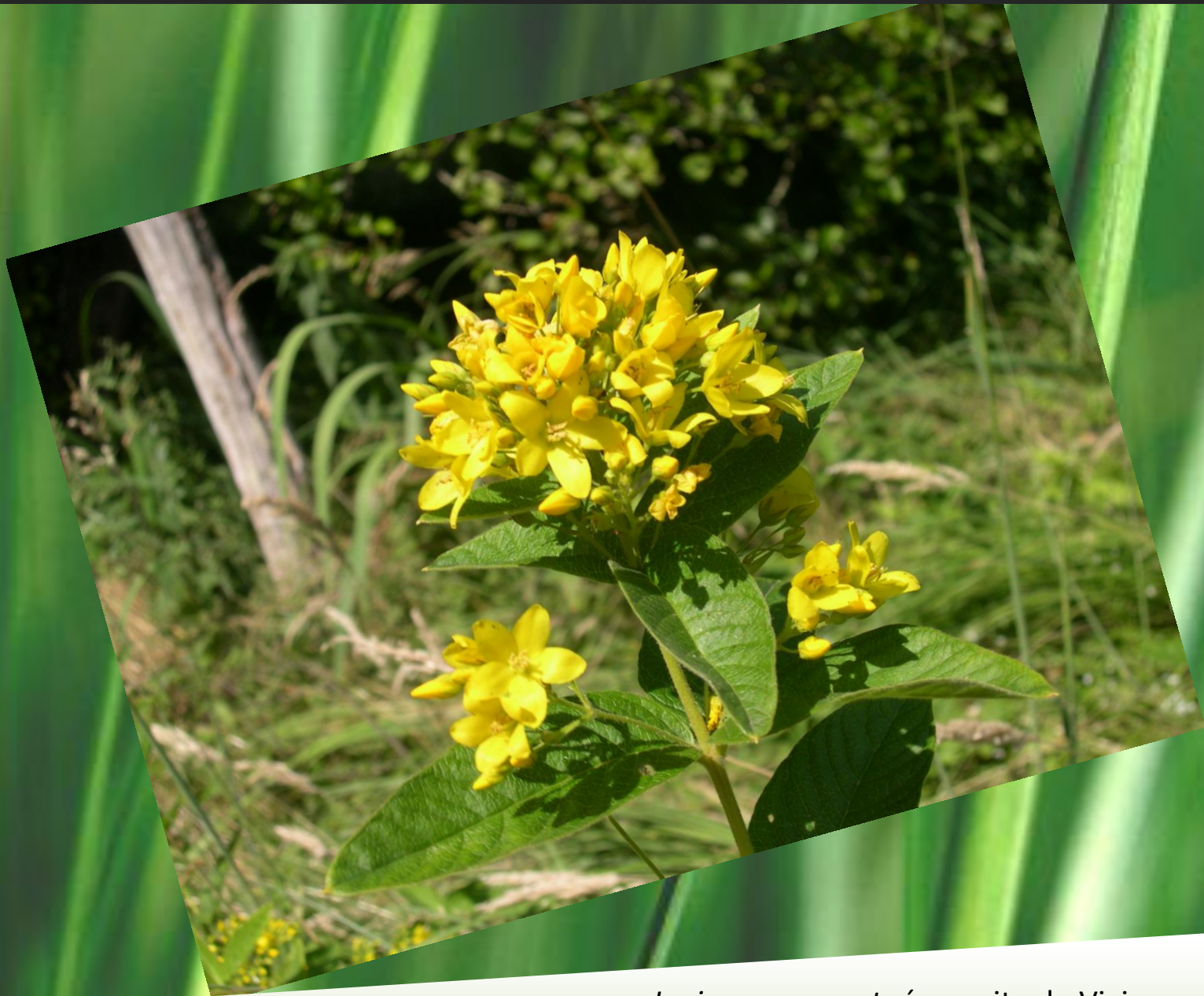
Lysimachie ponctuée au site du Vivier