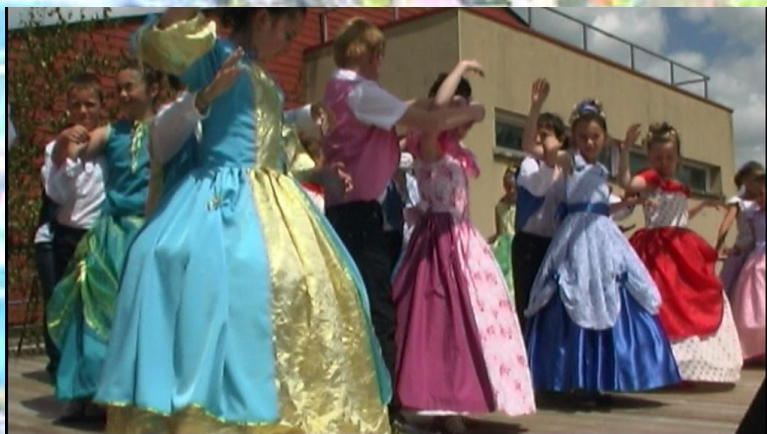
Fête de l'école