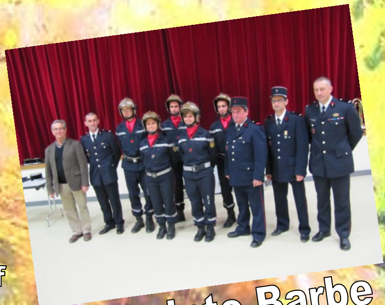
La Sainte Barbe